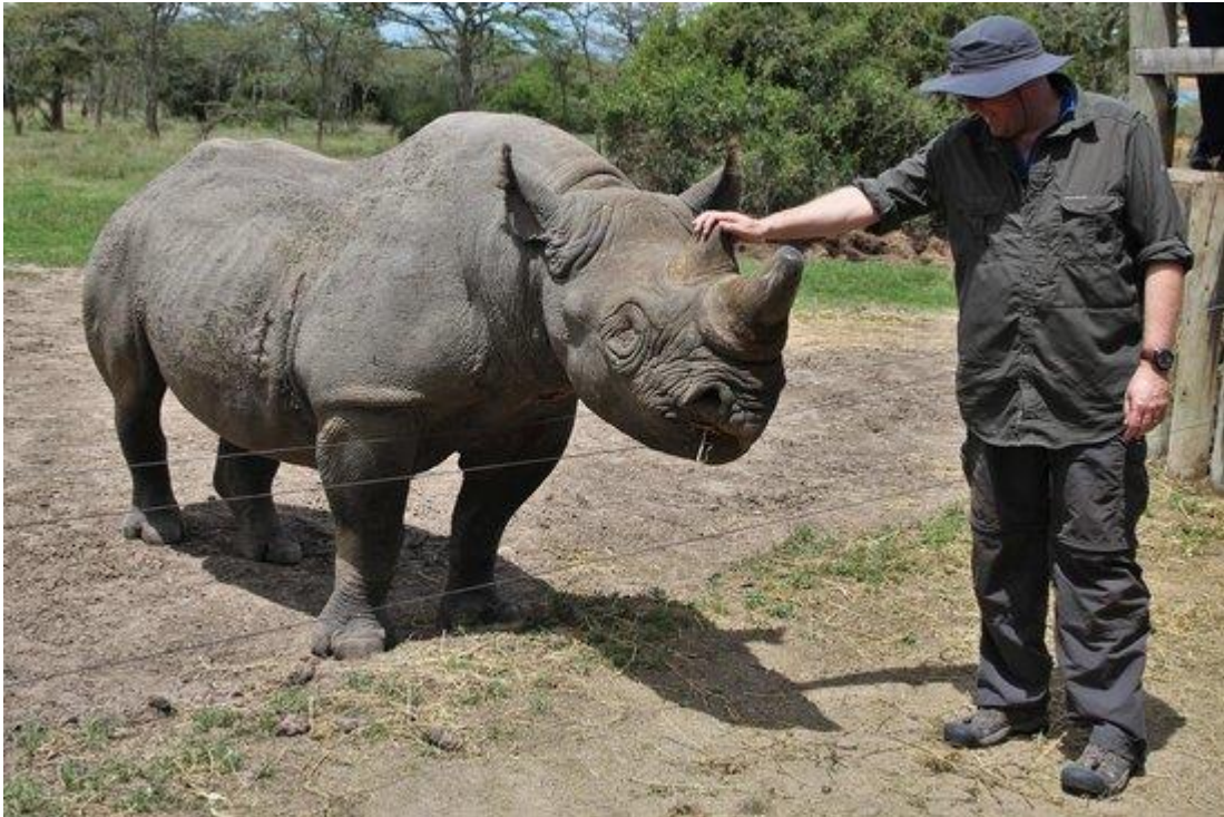
Cena y alojamiento en SWEETWATERS TENTED CAMP