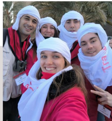
Más de 20 años de grandes viajes con animación